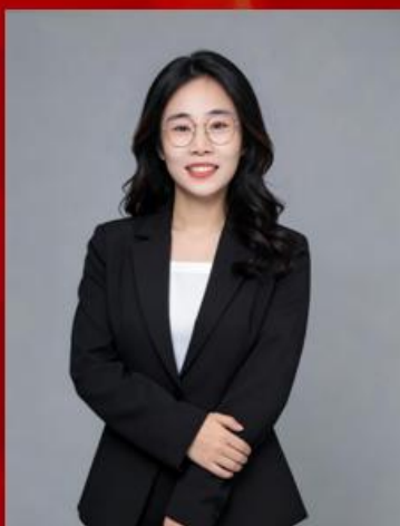
陈姿霖 文学与新闻传播学院 《当红色故事“触网”生长—— 网络思政的云端育人破局记》